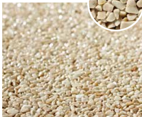
Naturstein-Teppich beige Korngröße: 2–4 mm