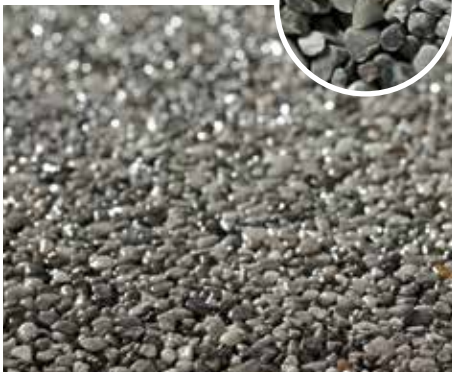
Naturstein-Teppich grau Korngröße: 2–4 mm