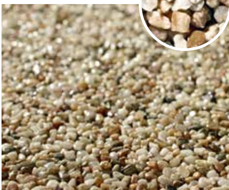
Naturstein-Teppich Donaflußkiesel Korngröße: 2–4 mm