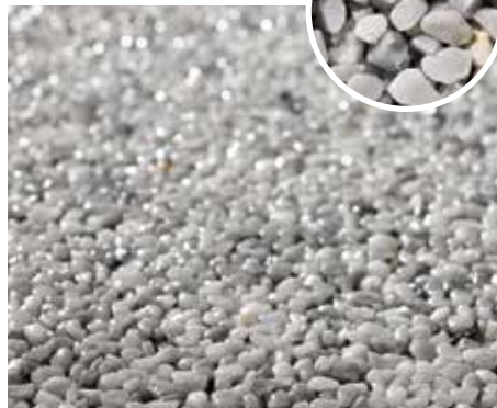
Naturstein-Teppich nebelgrau Korngröße: 2–4 mm