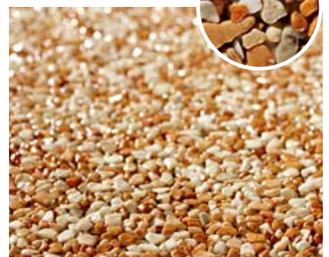
Naturstein-Teppich rosé gemischt Korngröße: 2–4 mm