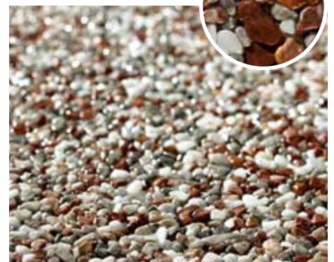
Naturstein-Teppich braun gemischt Korngröße: 2–4 mm